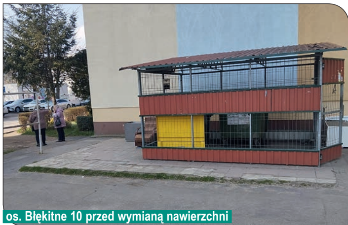
os. Błękitne 10 przed wymianą nawierzchni

wykonano nową nawierzchnię z kostki betonowej i gysu.