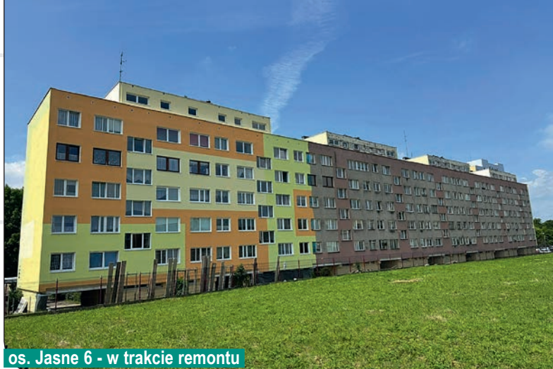
os. Jasne 6 - w trakcie remontu

zakończyliśmy prace związane z remontem dachów w syste- mie HYDRONYLON.