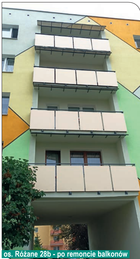
os. Różane 28b - po remoncie balkonów