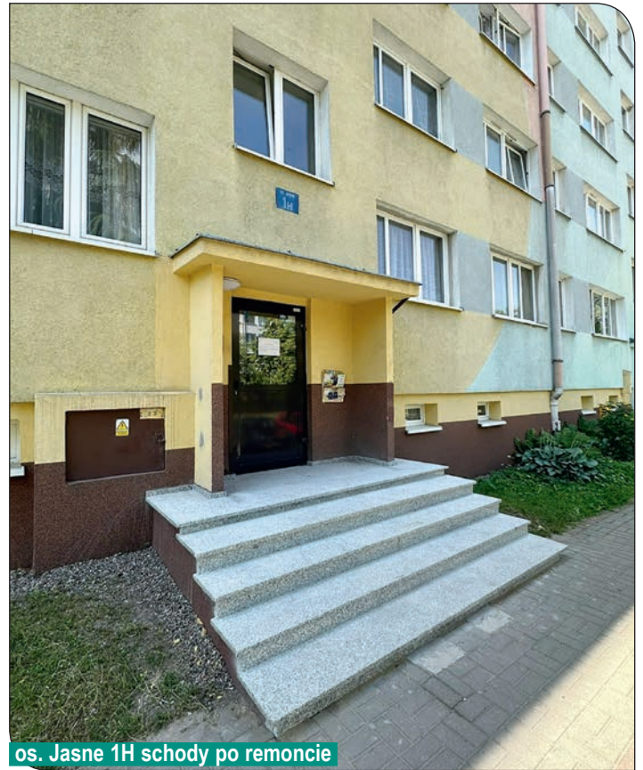
os. Jasne 1H schody po remoncie