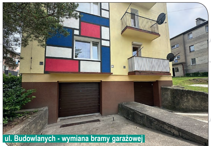
ul. Budowlanych - wymiana bramy garażowej