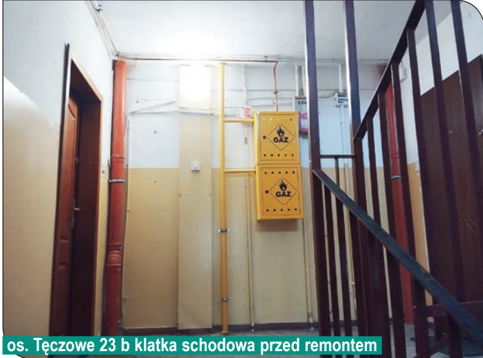
os. Tęczowe 23 b klatka schodowa przed remontem

scu lamperii położyliśmy tynk mozaikowy. Zamontowaliśmy również drewniane nakładki na poręcze oraz wymienione drzwi do piwnicy. W budynku na osiedlu Tęczowym 11 a,b,c rozpoczęliśmy w/w prace.