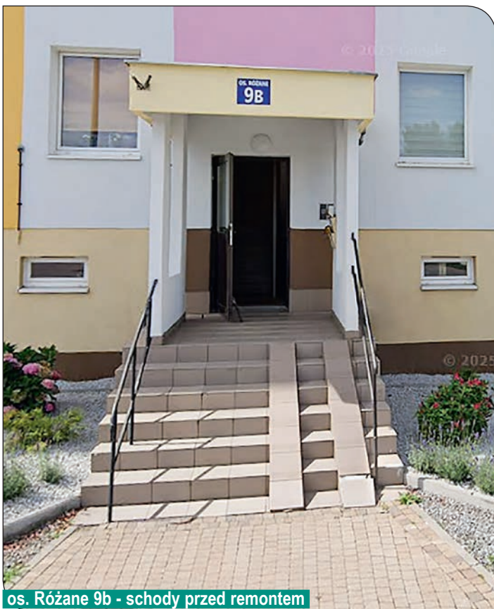
os. Różane 9b - schody przed remontem