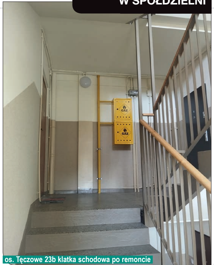
os. Tęczowe 23b klatka schodowa po remoncie