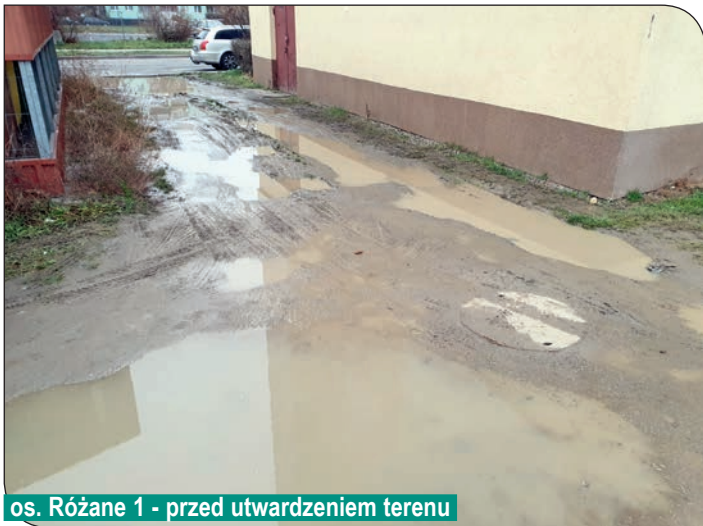
os. Różane 1 - przed utwardzeniem terenu

dzeniem terenu, wykonaniem wjazdu oraz chodnika.