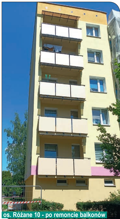
os. Różane 10 - po remoncie balkonów