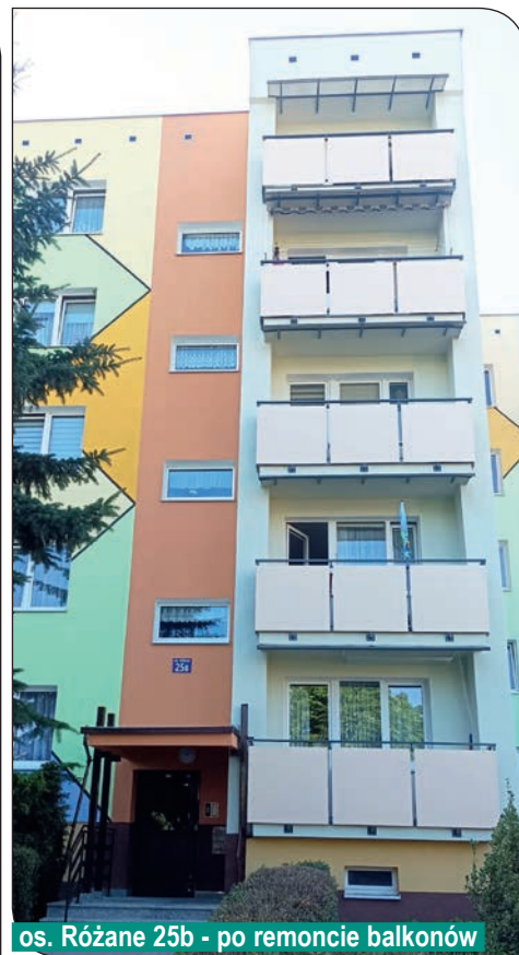
os. Różane 25b - po remoncie balkonów