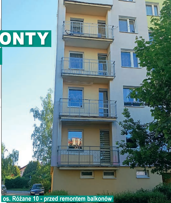
os. Różane 10 - przed remontem balkonów

ne zostały balustrady na nowe stalowe, ocynkowane, malowane farbą proszkową, na balustradach zamontowane zostały panele ozdobne. W ramach prac związanych z remontem balkonów zamontowane zostały nowe zadaszenia nad balkonami. W/w prace zostały rozpoczęte w budynku na os. Różanym 25c.