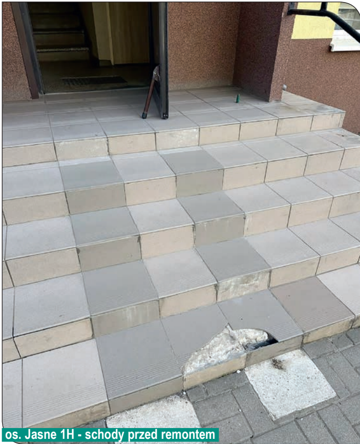
os. Jasne 1H - schody przed remontem