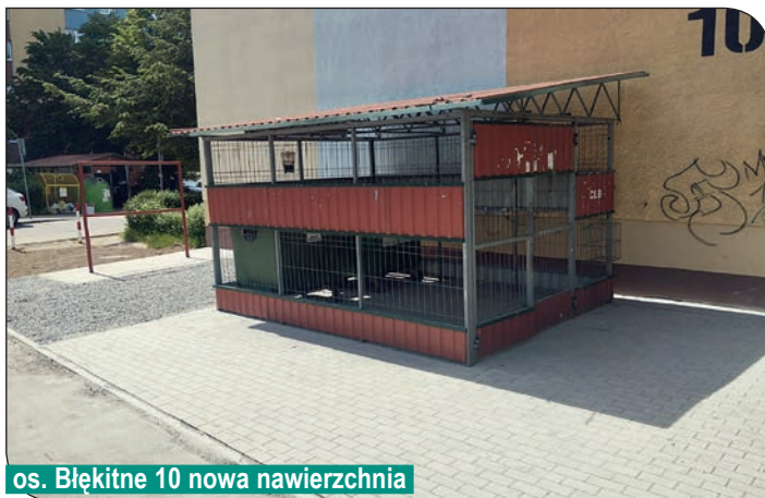
os. Błękitne 10 nowa nawierzchnia