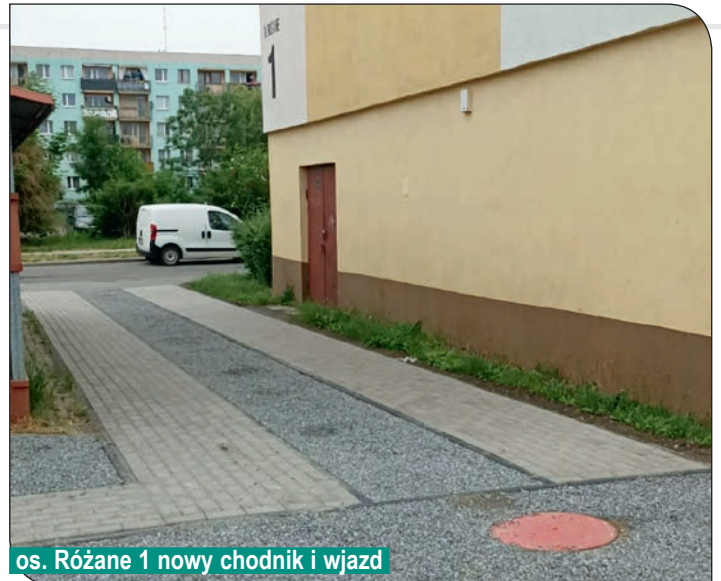
os. Różane 1 nowy chodnik i wjazd